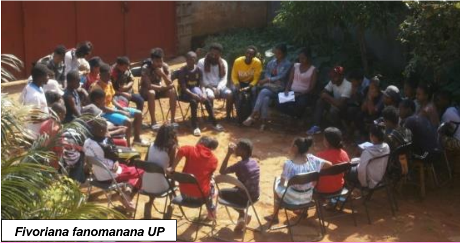
Fivoriana fanomanana UP

"Trano fonenana mendrika ho an'ny rehetra": izay no lohahevity ny "Université populaire" ny Asabotsy 30 Marsa 2019, teny amin'ny tranon'ny Fikambanana teny Ambohibao. Vory teo daholo ireo voakasik'izany: ny fianakaviana mpikatroka ato amin'ny Firohotana, indrindra ny avy eny Andramiarana izay rava trano, ny solontena avy any amin'ny Ministeran'ny Fanajariana ny tany, ny Toeraponenana sy ny Asa vaventy ary ireo tompon'andraikitra ao amin'ny ENDA mikasika ny: