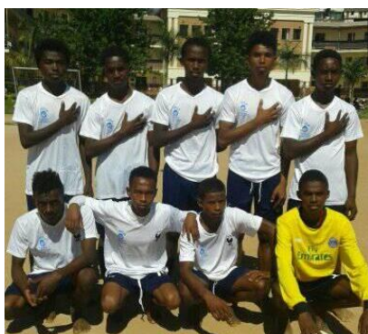
Les joueurs d'ATD Quart Monde

Nandray anjara tamin'ny baolina kitra nifanaovan'ny samy ONG ny tanoran'ny Firohotana ATD Quart Monde nanomboka ny 13 avrily. Tamin'ny andro voalohan'ny fihaonana dia nandresy ny ekipan'ny MANDA tamin'ny salan'isa 1-0 izy ireo Raha io no mitohy dia antenaina fa ho tompondaka amin-dry zareo samy mpifanandrana ny tanoran'ny ATD Quart Monde. Amin'ny 13 jolay 2019 izao izy ireo no hiatrika ny lalao famaranana ka ny VSOS no ekipa hifandrana aminy.