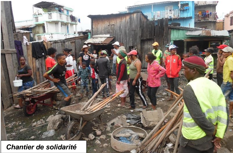
Chantier de solidarité

"Je fais ceci pour le bien de mes enfants et la propreté de mon quartier"