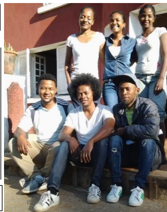
Les 5 stagiaires avec une autre en découverte du volontariat