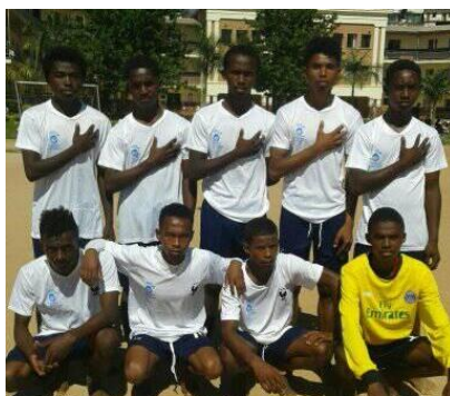
Les joueurs d'ATD Quart Monde

lever ses enfants, être ignoré, ne pas être entendu, ne pas être respectés dans ses droits, être méprisé dans l'exercice de son travail, être vu comme un profiteur des aides sociales, etc.. Les conclusions de ces travaux ont été présentées lors d'une conférence qui s'est tenue le 10 mai 2019 à l'OCDE (Organisation de Coopération et de Développement Économiques) à Paris.