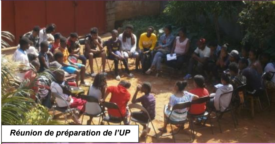
Réunion de préparation de l'UP

"Un logement digne pour tous": tel était le thème de l'Université populaire du samedi 30 mars 2019 , à la maison Quart Monde Ambohibao. Tous les acteurs concernés étaient présents: les familles militantes du Mouvement, notamment celles d'Andriamarana dont les maisons ont été démolies, des représentants du Ministère de l'Aménagement du Territoire et du Logement et des responsables de l'association ENDA, porteuse du projet "Un Logement Digne pour Tous"