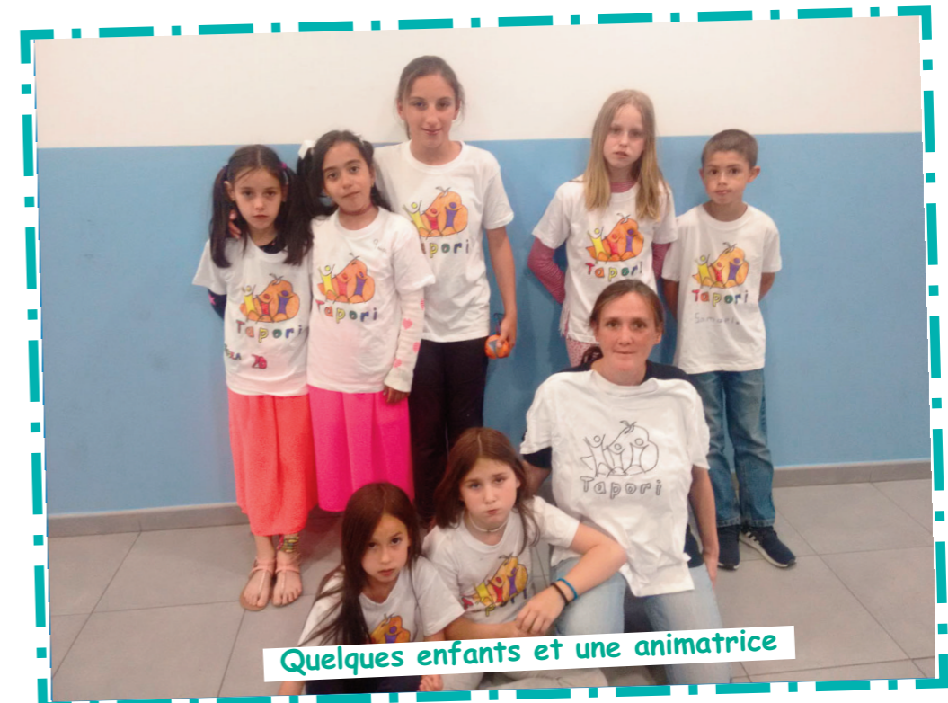
Quelques enfants et une animatrice

Nous sommes le groupe Tapori Ventilla de Madrid, en Espagne.