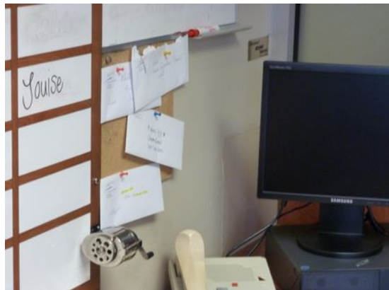
Photo 2. Enveloppes «alerte-bébé» affichées à la maternité indiquant les cas de signalement à la DPJ présentée par une professionnelle de la santé pour illustrer la rigidité du système de soins.

C'est pas la DPJ qui est la barrière, mais la barrière c'est quand même qu'il y a des jugements, qu'il y a deux mondes d'incompréhension, qui font que parfois on est rendu là quand c'était peut-être pas nécessaire de se rendre là. Alors on a parlé de rigidité, on a parlé de l'écart entre deux mondes, le monde des professionnels, système de soins de santé et le vécu. [...] Pour qu'on arrive à enlever un bébé à une maman, on a atteint une limite que moi je trouve que... il aurait fallu peut-être trouver autre chose.