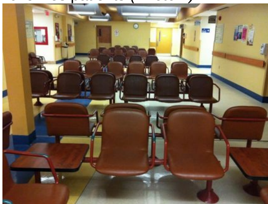
Photo 1. Salle d'attente présentée par un membre de l'équipe de soins pour représenter le temps d'attente que vivent les patients et la contrainte de temps imposée aux professionnels de la santé.

Le manque de temps à accorder aux patients engendre plusieurs limitations pour les membres des équipes de soins et ne leur permet pas de mieux connaître la situation de leurs patients, de transmettre toute l'information nécessaire aux patients en s'assurant de sa compréhension, de procéder à une bonne évaluation clinique ou de remplir efficacement les formulaires et autres demandes administratives. Ils ont également l'impression que le manque de temps les limite dans leurs interventions préventives, car ils doivent constamment traiter les urgences, ce qui leur laisse peu d'occasions pour faire de l'enseignement et de l'éducation aux patients. De plus, lorsqu'ils accordent plus de temps à un patient qui en a besoin, cela engendre des retards considérables dans l'horaire et occasionne de la frustration chez les patients ( Photo 1 ).