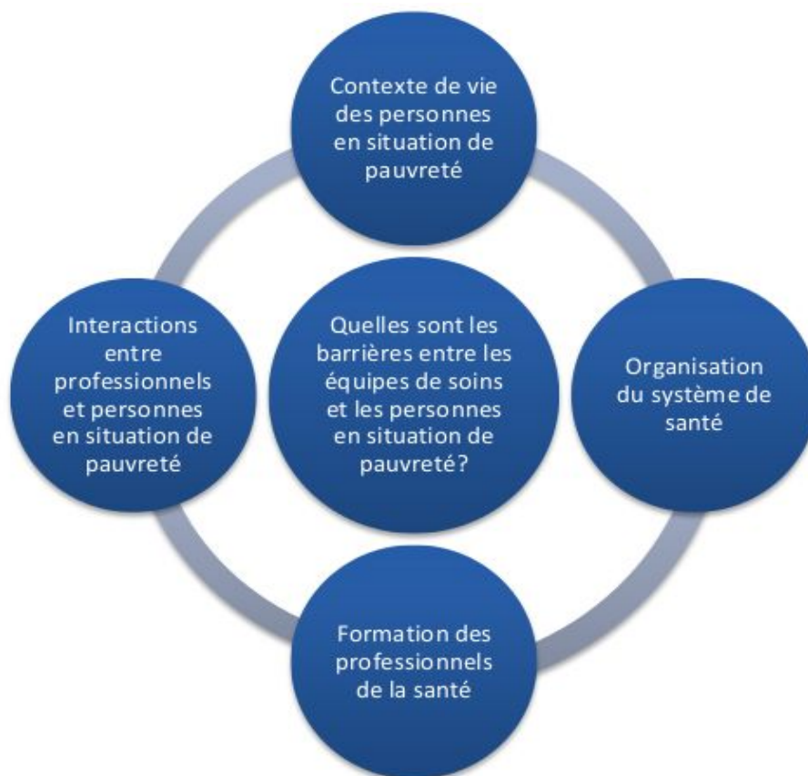
Schéma présentant les quatre barrières identifiées et analysées par le comité de pilotage du projet de recherche ÉQUISANTÉ :