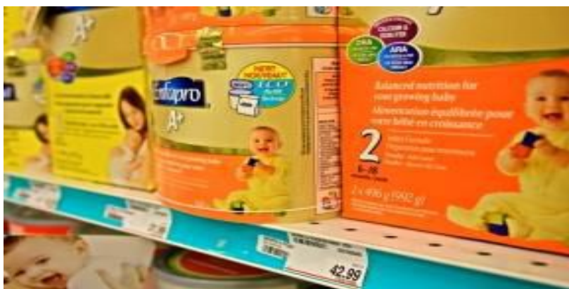
Photo 5. Photographie prise par une professionnelle de la santé qui représente le lait maternisé

Lors d'une des rencontres entre personnes en situation de pauvreté et professionnels de la santé (ÉQUISanTÉ), des discussions ont eu lieu sur le choix qu'ont les mamans qui viennent d'accoucher : allaiter leur enfant ou lui donner du lait maternisé.