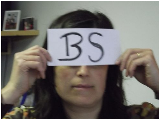
Photo 3. Étiquette «BS» présenté par un membre d'ATD Quart Monde pour représenter les préjugés que vivent les personnes en situation de pauvreté.

"Il y a la barrière de l'étiquette BS, bien-être social. Femmes pauvres = imbéciles et paresseuses. Il y a les préjugés qui sont une vraie barrière entre les personnes en situation de pauvreté et les équipes de soins." (Photo 3)