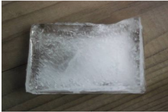
Photo 6. Photographie prise par une personne en situation de pauvreté pour illustrer la barrière de la communication

Le bloc de glace, c'est un médecin qui a reçu une formation scientifique, qui est bon médecin, mais qui est incapable de communiquer. Il s'agit, dans la manière de former les médecins, de choisir les candidats en médecine. La communication est aussi importante que la science. La capacité de rentrer en relation avec les gens, la barrière c'est la formation. (Militant ATD Quart Monde - ÉQUIsanTÉ)