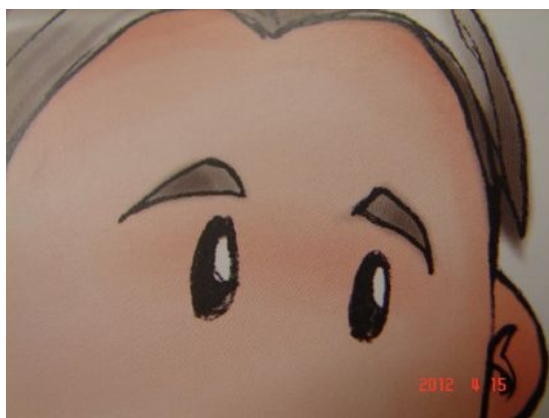
Photo 4. Photographie prise par une professionnelle de la santé qui représente les jugements envers les personnes en situation de pauvreté et le regard qui peut être porté sur elles.

Les membres des équipes de soins ont également reconnu que les professionnels ont parfois certains préjugés à l'égard des personnes en situation de pauvreté et croient que cela peut provenir des limites auxquelles font face les professionnels, que ce soit au niveau de leurs limites personnelles (ex. : ils ne se sentent pas à l'aise de travailler avec des personnes en situation de pauvreté) ou de celles du système (ex. : ils sont mal outillés pour faire face à ces situations complexes). Bien que les membres de l'équipe de soins ont constaté que certains professionnels entretiennent des préjugés, peu ont admis avoir eux-mêmes des idées préconçues à l'égard des personnes en situation de pauvreté. Les préjugés et les étiquettes accolés aux personnes en situation de pauvreté sont demeurés un sujet délicat à aborder par les membres des équipes de soins en présence des membres d'ATD Quart Monde. Comme l'a exprimé cette professionnelle : La photo de l'étiquette de B.S., pour moi ça m'aurait pris du courage, puis je l'ai pas eu. C'est juste ça. Cette étiquette B.S., on a tourné autour du pot. J'ai tourné autour du pot, mais il est réel quand même, celui-là. Il y a juste vous [les membres d'ATD Quart Monde] qui avez osé. C'est vous qui le portez, puis ça prend beaucoup de courage.