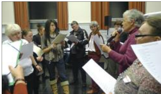
Soirée conviviale autour du chant. Bruxelles, 4 mars 2012.