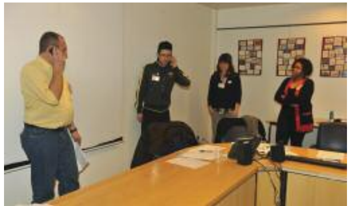
Un atelier du matin prépare une saynète à représenter en plénière. Bruxelles, 5 mars 2012.

pour les jeunes. Car chaque jeune qui venait à la réunion en parlait autour de lui dans son école, dans son quartier avec ses amis. Je l'ai fait dès la 6 e . On m'a pris en considération, on m'a demandé mon avis, et c'est pour ça que je me sens citoyenne, c'est pour ça que je m'intéresse à ce qui se passe autour de moi. On est venu me voir, et on m'a dit : « Oui toi, je veux savoir ce que tu penses, dis-moi ce que tu veux, tu as le droit de le dire, et on t'écouterà. »