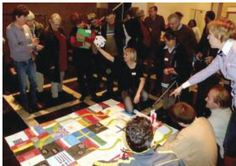
Jeu sur la citoyenneté, apporté par la délégation polonaise. Bruxelles, 4 mars 2012.