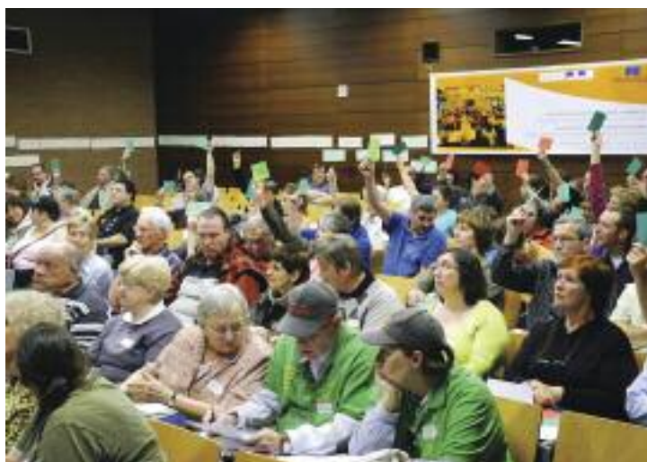
Université populaire Quart Monde «Droit de vote et élections communales». Belgique.