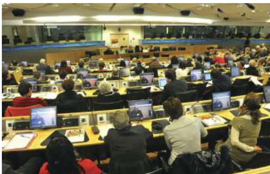
Université populaire Quart Monde CESE, Bruxelles, 5 mars 2012.