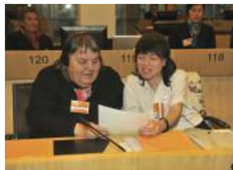
Lecture d'un texte sur la citoyenneté. Bruxelles, 5 mars 2012.

Pour qu'une telle formation soit possible, il est nécessaire que ce que nous apportons soit reconnu de même valeur que ce qu'apportent les professionnels.