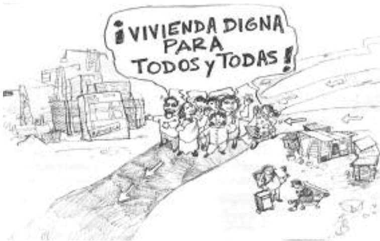
Un logement digne pour tous et toutes. Espagne

Beaucoup de personnes ne savent pas que ce droit au logement opposable existe et elles n'en font pas la demande. D'autres la font mais, même si elles y ont droit, elles n'obtiennent pas toujours satisfaction, car il y a un manque de logements.