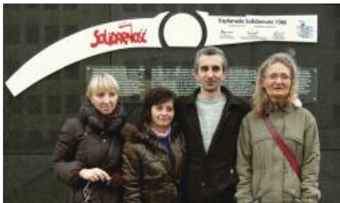
Des participants de la délégation polonaise. Bruxelles, 4 mars 2012.

Les Universités populaires Quart Monde se sont préparées à cette rencontre.