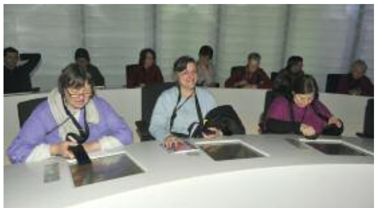
Des délégations visitent le Parliamentarium. Bruxelles, 4 mars 2012.

Ce qui nous rassemble et nous motive, c'est l'ambition d'apprendre ensemble, les uns des autres, une citoyenneté capable de bâtir une Europe des droits de l'homme, de la démocratie et de la paix.