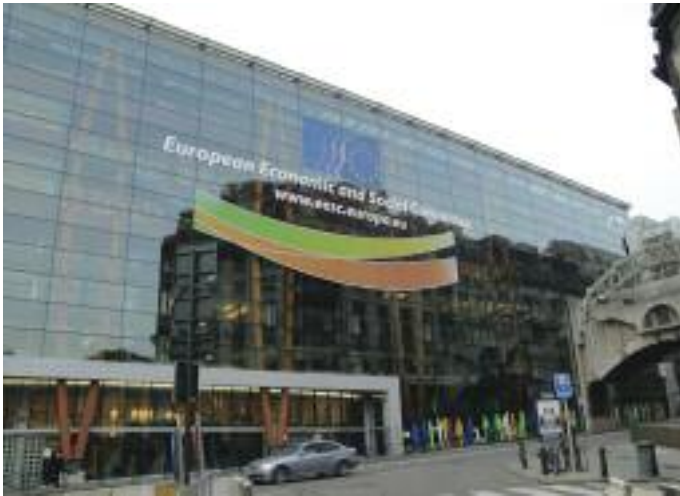
Le Comité économique et social européen. Bruxelles, Belgique.

Le 5 mars 2012, au cours de l'Université populaire Quart Monde européenne, nous avons voulu relever le défi du dialogue entre deux mondes qui habituellement ne se rencontrent pas et ne se comprennent pas : personnes vivant dans la pauvreté et l'exclusion sociale, militants d'associations et professionnels engagés à leurs côtés et responsables européens.