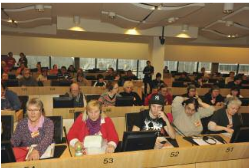
Université populaire Quart Monde, CESE, Bruxelles, 5 mars 2012.

C'est aussi en créant cette voie-là que l'Union européenne poursuivra le projet de ses fondateurs : projet de paix entre les personnes et entre les peuples.