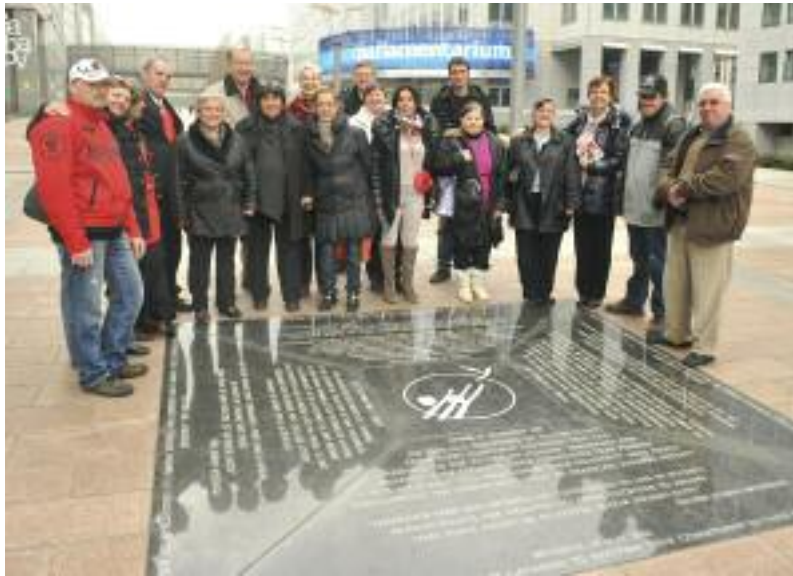
Des délégations de différents pays devant la réplique de la dalle à l'honneur des victimes de la misère. Bruxelles, 4 mars 2012.

Nous ne vivons pas tout seuls, mais entourés d'autres être humains qui se sont organisés pour vivre ensemble. Avec eux, nous formons une société. Nous sommes citoyens quand nous sommes en relation avec les autres, quand nous nous sentons respectés, reconnus, quand nous trouvons notre place.