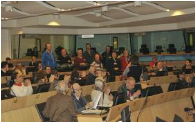
La délégation des Pays-Bas. Bruxelles, 5 mars 2012.

Autres conséquences, tu perds ton droit de vote pour les élections locales. Si tu ne peux pas fournir d'adresse, il est beaucoup plus difficile de trouver du travail, de te soigner. Et si ta carte d'identité n'est plus valable, c'est alors très difficile de pouvoir renouveler ta carte d'identité. Tu deviens un réfugié dans ton propre pays. Et cela a aussi des conséquences sur le montant du droit à l'allocation vieillesse à l'âge de la retraite.