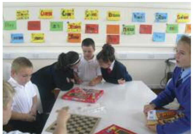
Des enfants du groupe Dorset Street, à Dublin, Irlande.

d'appartements qui appartient aux autorités locales. Ce bâtiment a été construit au début des années 50. Il y a environ 10 ans, le conseil municipal nous a affirmé qu'ils allaient rénover le bâtiment, mais rien ne s'est passé et les conditions de vie sont de plus en plus difficiles. Par exemple certains parmi nous n'ont plus d'eau chaude depuis des mois et les toits fuient. Tout le quartier est laissé à l'abandon. Les résidents se sont rassemblés pour la première fois à la fin de 2008 pour faire pression sur les autorités afin qu'on maintienne et qu'on garde l'espace de jeux en bas du bâtiment. Avec l'aide de la travailleuse sociale, une vingtaine de familles se sont réunies sur l'espace de jeux. Nous avons invité des représentants du secteur public à venir se joindre à