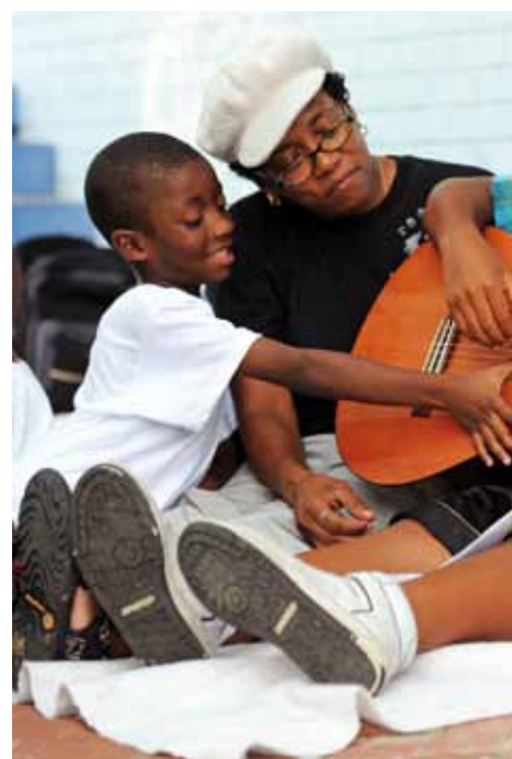
Apprendre à jouer la guitare au Festival des savoirs et des arts de la Nouvelle-Orléans, aux États-Unis