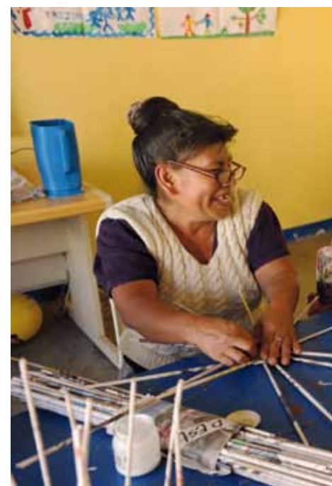
TAJ – Trabajar y Aprender Juntos à Guatemala City, au Guatemala