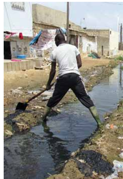
La Brigade des Jeunes contre les Inondations, à Guinaw Rail, à Dakar, au Sénégal