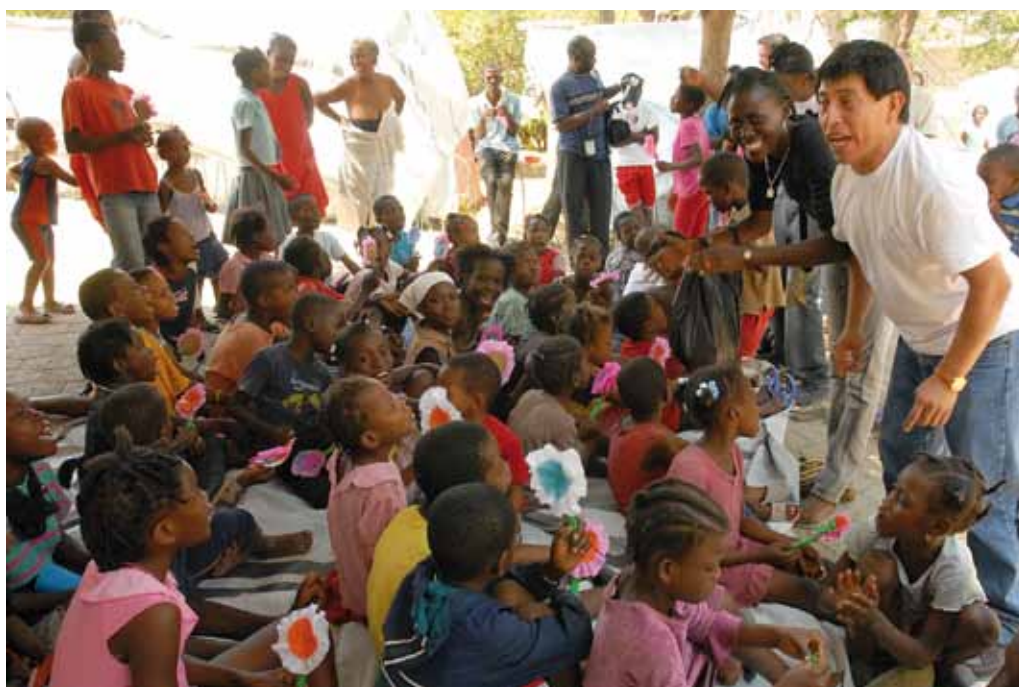
Des activités pour les enfants et les parents du campement temporaire de Port-au-Prince, deux mois après le tremblement de terre de 2010.

Mouvement ATD (Agir Tous pour la Dignité) Quart Monde 12, rue Pasteur 95480 Pierrelaye, FRANCE Tel : 00 33 (0) 1 34 30 46 10 Fax : 00 33 (0) 1 30 36 22 21 www.atd-quartmonde.org/Contact.html