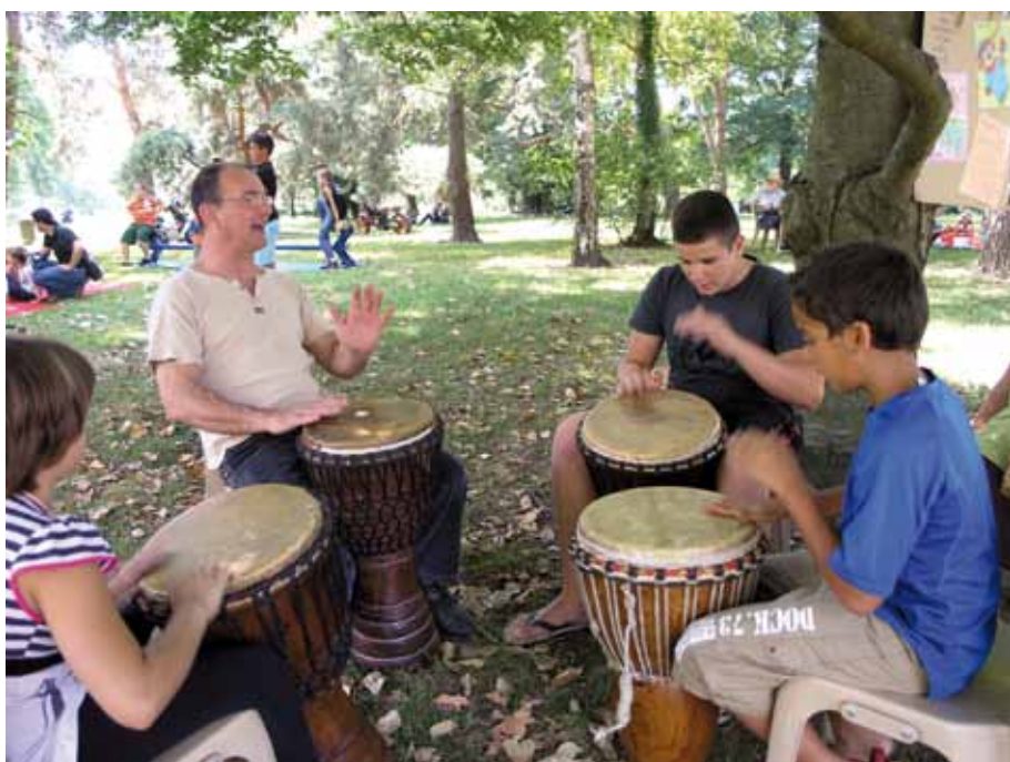
Un atelier de percussion au Festival des savoirs et des arts de Bayonne, en France