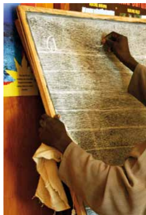
Des classes d'alphabétisation de Swahili avec tous les âges à Dar Es Salaam, en Tanzanie