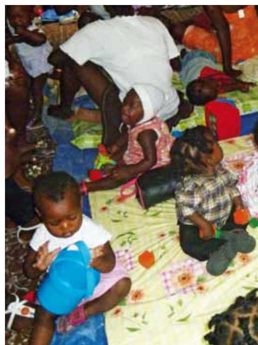
Haïti. Activités d'apprentissage pour des enfants de 0 à 3 ans avec la participation active de leurs parents.