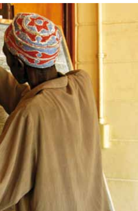
des personnes de