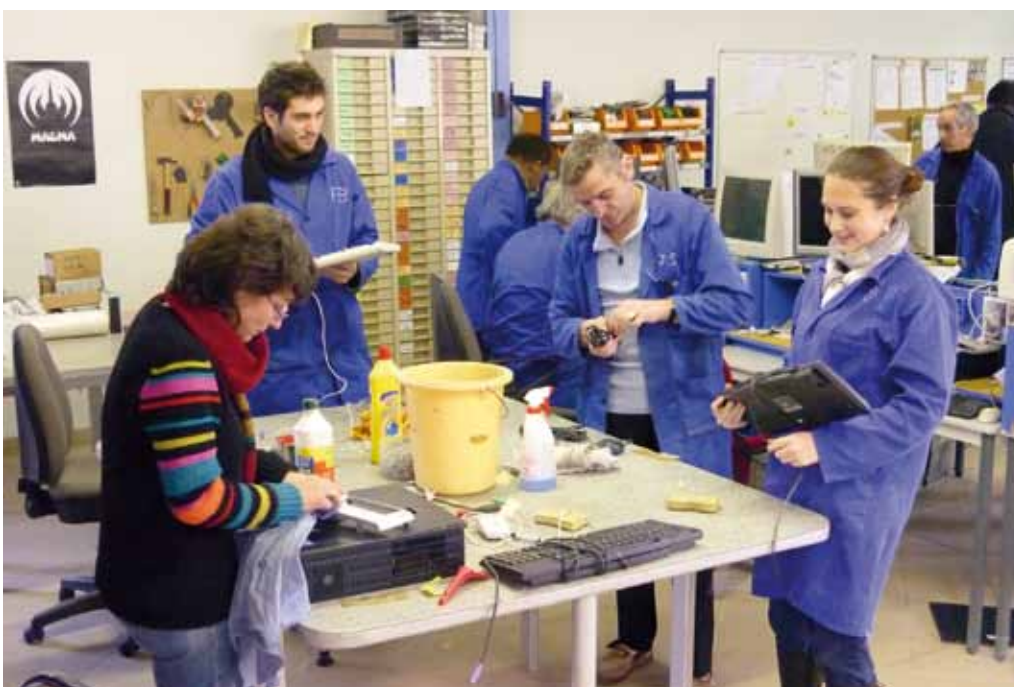
TAE – Travailler et Apprendre Ensemble à Noisy-le-Grand, en France

À cette fin, ATD Quart Monde a commencé le projet « Travailler et Apprendre Ensemble » à Noisy-le-Grand, en France ; à Antananarivo, à Madagascar ; et à Guatemala City, au Guatemala. Ce projet réunit