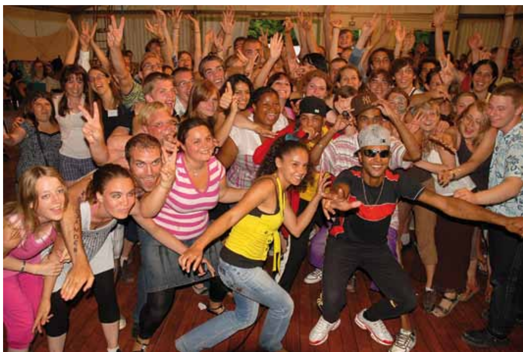
« Ce qui nous unit c'est notre refus de ne rien faire et de permettre à la pauvreté et l'exclusion que nous voyons tout autour de nous de continuer. »