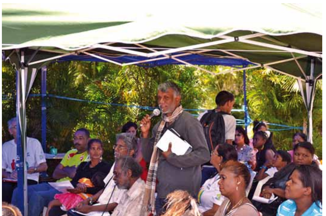
Des personnes en situation de pauvreté prennent la parole pour le 17 octobre, République de Maurice.