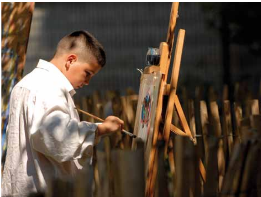
Un atelier de peinture lors d'un Festival des savoirs et des arts en Belgique

L'exposition Itinérante d'ATD Quart Monde aux Philippines a été lancée le 16 octobre 2011 au Parc Rizal, à Manille après la commémoration de la Journée mondiale du refus de la misère. Les croquis avaient été dessinés pas l'artiste Robert Alejandro. Les personnes dessinées marchent avec leurs bannières. Dans cette création collective, des artistes, des experts en communication, et des personnes vivant la pauvreté extrême au quotidien, ont donné de leur temps et de leur savoir pour qu'émerge une parole légitime sur la pauvreté : une voix qui défend la dignité de chaque personne.