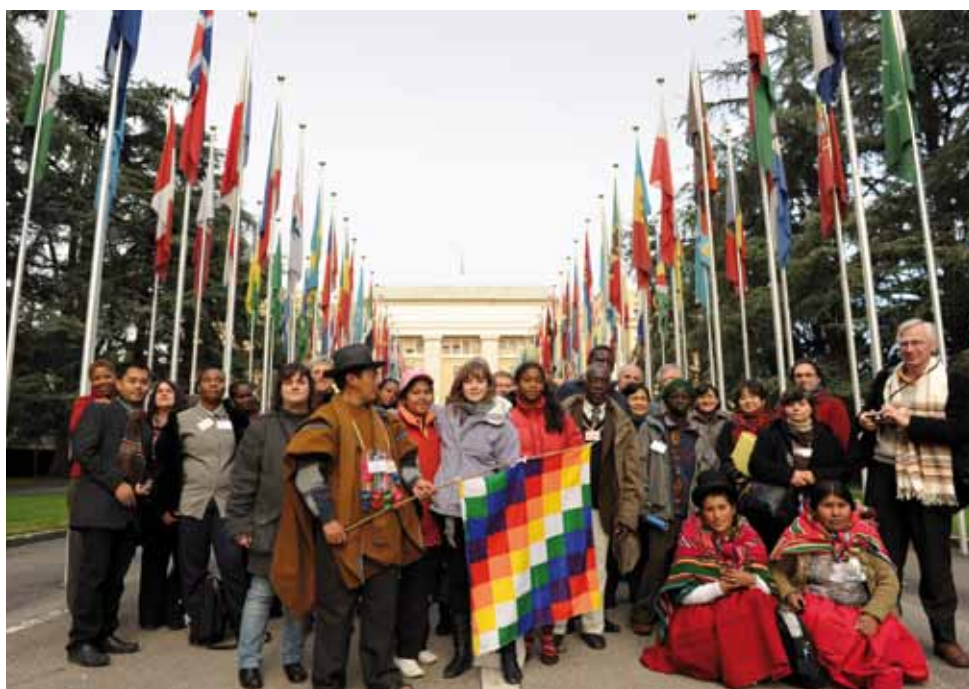
Une délégation internationale d'ATD Quart Monde aux Nations Unies à Genève

Le 17 octobre 2011, plus de 250 événements ont été organisés dans plus de 40 pays.