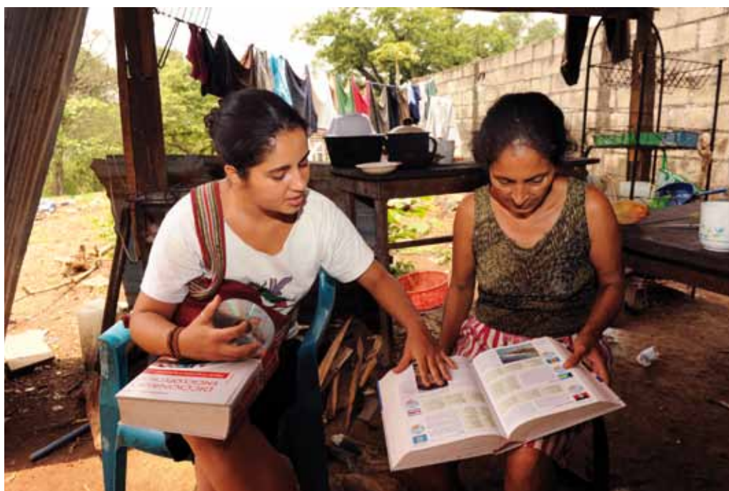
Au Guatemala, en découverte de Madagascar