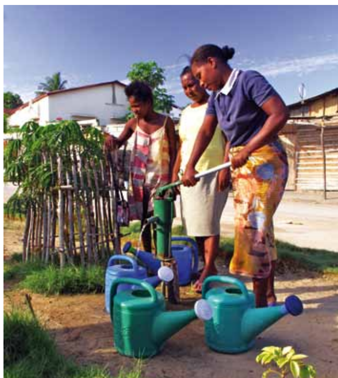
Le projet de reforestation de Miasa Miantra Miraka – Travailler et Apprendre Ensemble, au Madagascar