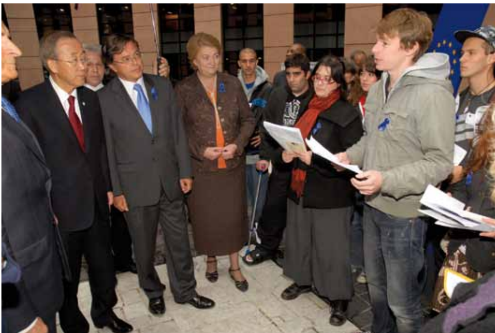
Une délégation de jeunes d'ATD Quart Monde rencontrent M. Ban Ki-moon, le Secrétaire Général des Nations Unies

Un autre endroit où les jeunes jouent un rôle important dans le travail d'ATD Quart Monde est à Guinaw Rails, une banlieue marginalisée de Dakar, au Sénégal, qui souffre d'énormes inondations, et ne bénéficie ni d'installations sanitaires ni d'un service de ramassage d'ordures. Les inondations laissent des mares d'eaux croupissantes qui deviennent des zones propices à la reproduction d'insectes et de bactéries, et donc de maladies. En 2010, un groupe de jeunes membres d'ATD Quart Monde de ce quartier s'est rendu compte que certaines familles avaient construit des petits canaux qui protégeaient seulement leur maison, aggravant les effets de l'inondation dans les autres maisons, en particulier dans les maisons des plus pauvres, moins aptes à s'en sortir. ATD Quart Monde a apporté son soutien à ces jeunes