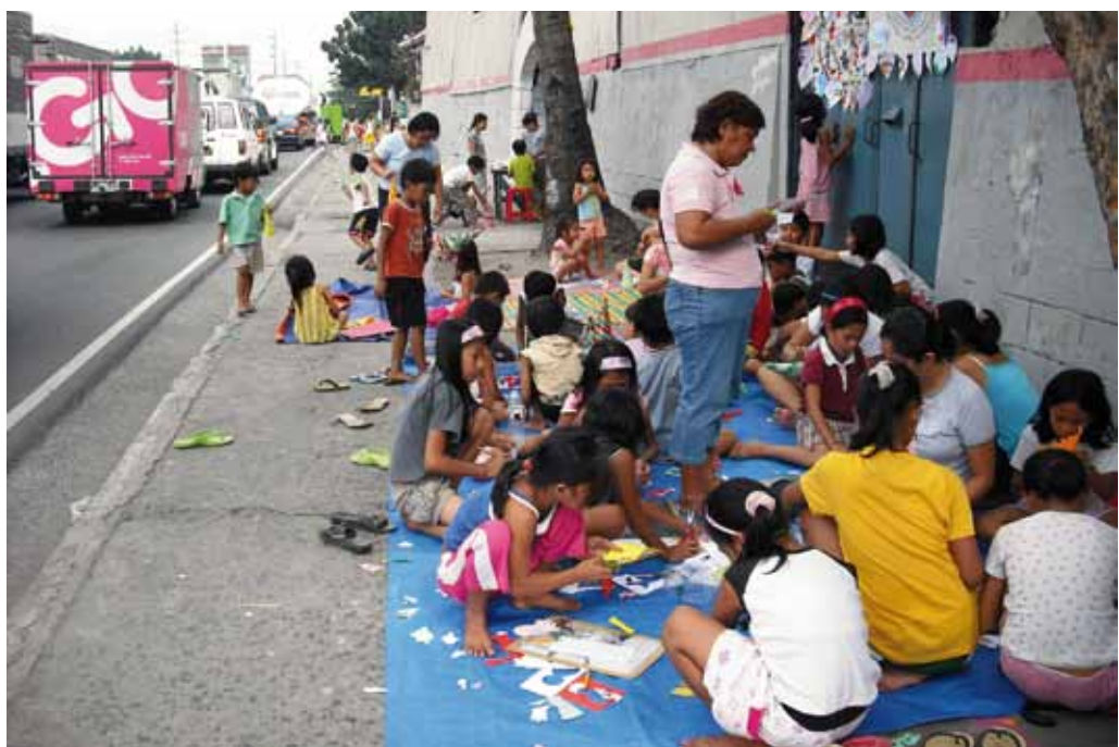
Une bibliothèque de rue typique, à Manille, aux Philippines

Le forum du refus de la misère est un réseau de personnes engagées qui invitent d'autres personnes à rejoindre le courant mondial du refus de la misère, et à reconstruire des communautés avec les personnes vivant dans la misère. L'objectif de ce Forum est de permettre aux gens de partager leurs expériences. Ils