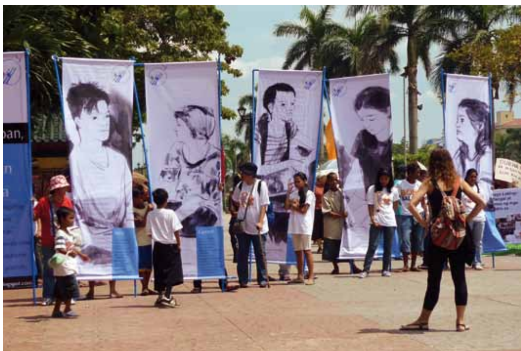
L'exposition Itinérante d'ATD Quart Monde aux Philippines

En 2010 un projet a commencé en Bolivie, près de La Paz, avec pour but d'unir des enfants de milieux très différents à travers la musique. Des ateliers de musique ont eu lieu à l'école Franco-Bolivienne, ainsi que dans le quartier d'Urkupifña, avec des enfants vivant dans la pauvreté extrême. Des réunions avec les deux groupes d'enfants ont été organisées deux fois