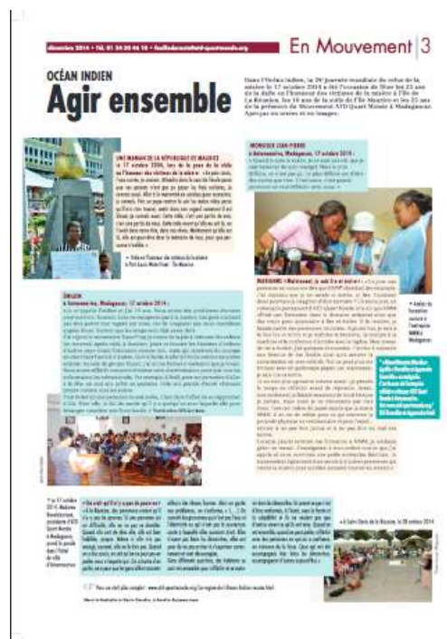
Feuille de Route n°445 - décembre 2014

https://www.atd-quartmonde.fr/wp-content/uploads/2014/12/FDR445-ATD_dec2014-HD.pdf