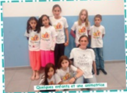
Quelques enfants et une animatrice

¡ Hola ! Nous sommes le groupe Tapori Ventilla de Madrid, en Espagne.