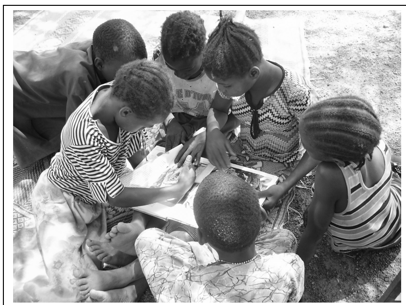
Bibliothèque sous les nimiers, à Bollé, commune de Méguet

Le fait que les animateurs aillent visiter les familles après une animation ou quand il y a un événement important dans la vie sociale du quartier (baptême, mariage, décès...) renforce la confiance des habitants.