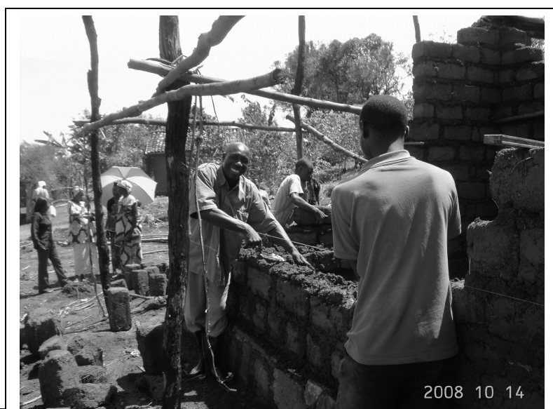
Chantier communautaire au Rwanda

Pour ce séjour, une délégation internationale de 11 personnes, dont deux du Burkina Faso, a rejoint « Les Amis de Atd Quart Monde au Rwanda ». L'objectif premier était de contribuer aux efforts de deux familles en les aidant à construire leur maison. Les « Amis de Atd Quart Monde », qui ont vécu l'isolement pendant des années, ont pris le temps de créer un véritable accord pour donner la priorité à ces deux familles qui vivaient auparavant dans des conditions précaires, alors que beaucoup d'entre elles sont aussi dans le besoin.